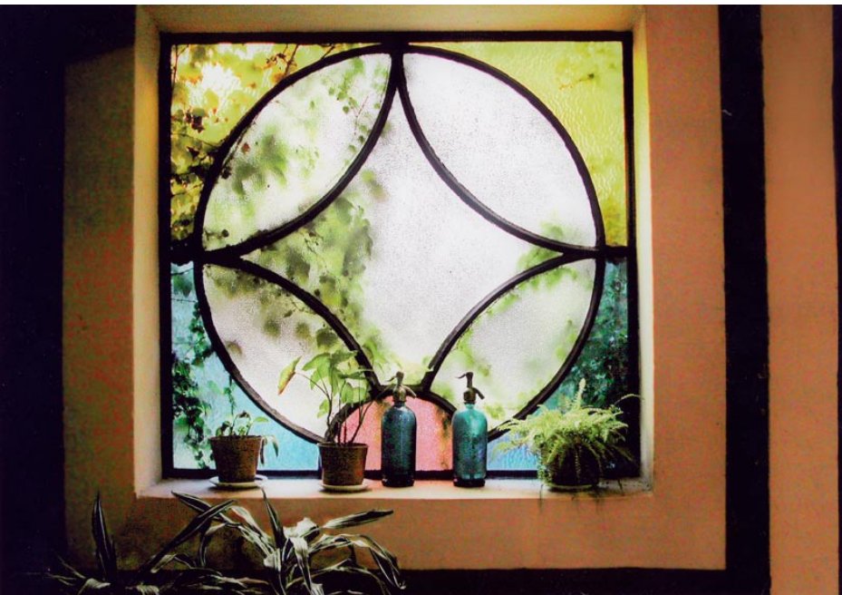
Título: La Sodería