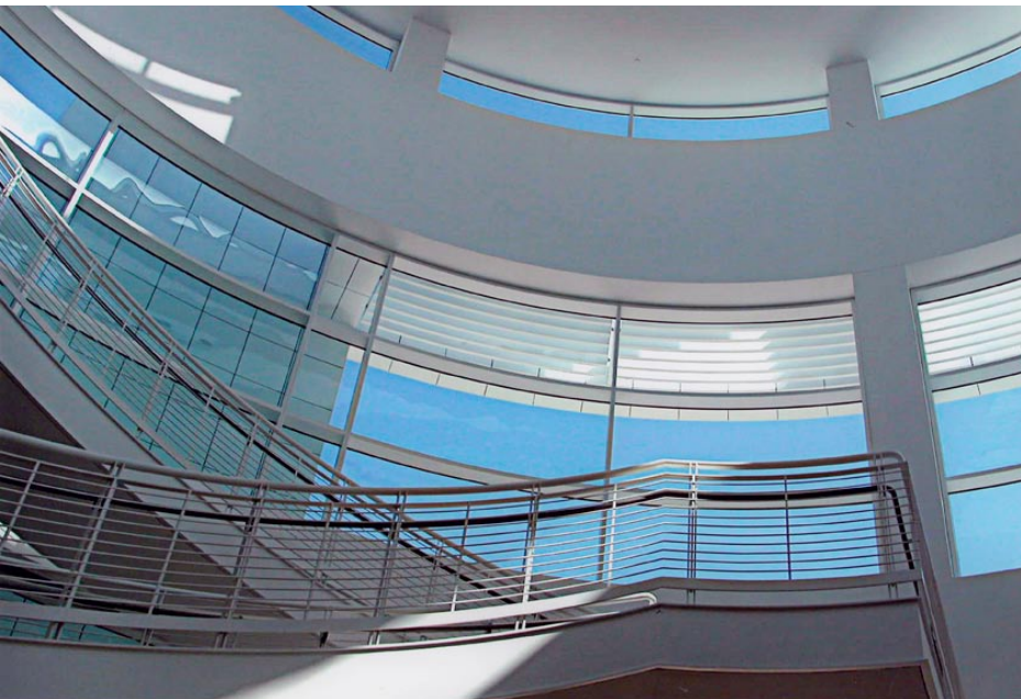
Título: Espacio Curvo