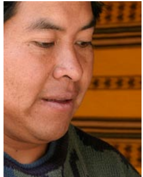
[Fig. 3. Enfocada]