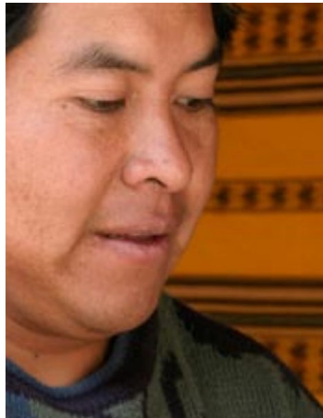
[Fig. 2. Original]

Las Fig. 2 y 3 muestran la foto antes y después de aplicar la máscara de enfoque con valores Cantidad 100, Radio 2,0 y Umbral 0.