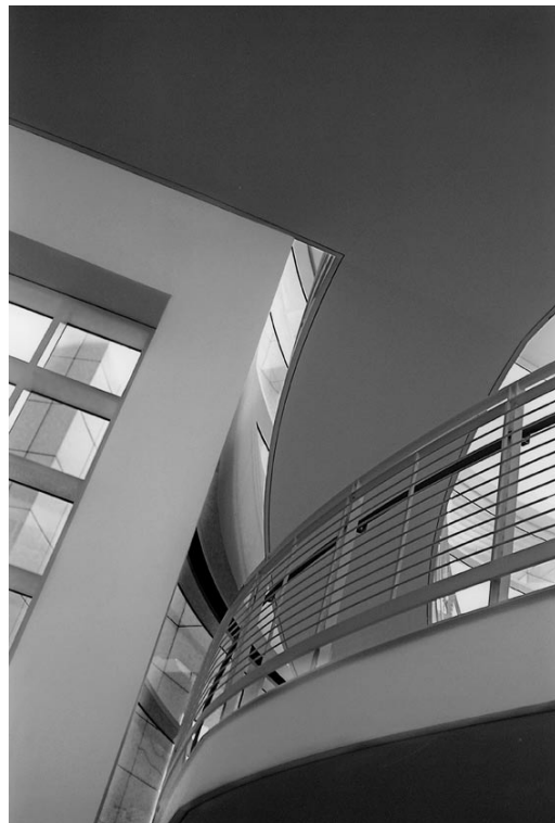
Título: Planos Cruzados